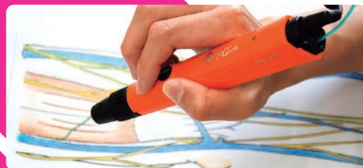
3Dペンを使って、自分の静脈モデルを作成しよう!