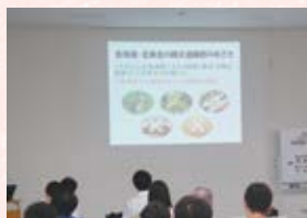
▲ 第1回 青森県縄文遺跡群の魅力を知る

青森県の縄文遺跡群を活用した観光振興・観光人財育成を目的として、あおりリズム創発塾セミナー(主催:青森中央学院大学地域マネジメント研究所/青森県)を開催しました。