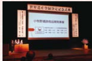
▲ 学生団体ディベラボによる小牧野遺跡との商品開発

青森市による「あおりフィールドスタディ支援事業」に、今年度、世界遺産登録を果たした縄文遺跡群を活用した企画が本学より2件採択され、活動を行っています。