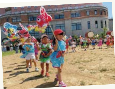
オリジナルの衣装を着て、 学内でねぶた祭りを楽しんだよ!