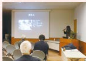
▲ 企画したプランを発表しよう