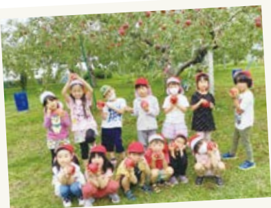
まっかなりんご、 ゲットでーす🍏