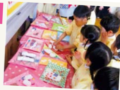
年少組保育参観 見て見て!上手にできましたよ。