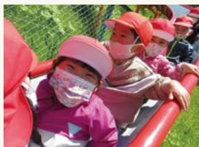
晴天の遠足! 友達と長い大型滑り台で遊んだり、 とても楽しかったよ。