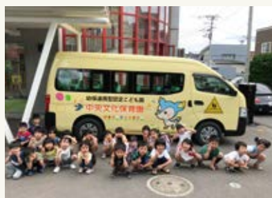
祝50周年 かわいいバスになりました!!