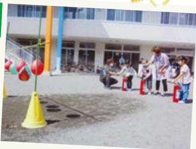
総合訓練を行いました。 目印の風船に向かってドキ・ドキしながら、 消火器で火を消すことができました。