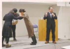
▲ 第2回 世界遺産を活用した ヘルスツーリズム～熊野古道 健康ウォーキングの取り組み～