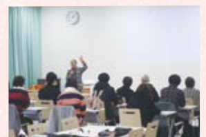
▲ 第3回 古代体験の郷『まほろば』の 取り組み～復元縄文集落を 活用した原始生活体験～