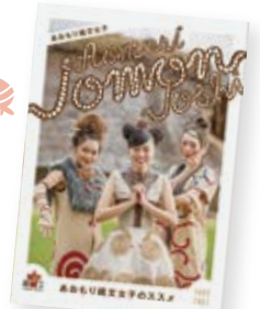
情報誌「あおり縄文女子」

「北海道・北東北の縄文遺跡群」の興味・関心を高め、女性の情報発信力を利用してPRする青森県の情報誌「あおり縄文女子」のモデルが着用する縄文服のひとつに、青森中央文化専門学校アパレル専攻の学生のデザインが選出されました。また、全ての衣装制作からメンテナンス、フィッターまで、学生が協力しました。