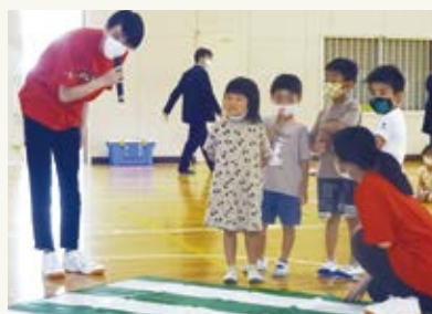
交通安全教室では、 短大のお兄さん、お姉さんと一緒に 横断歩道の渡り方を勉強したよ。