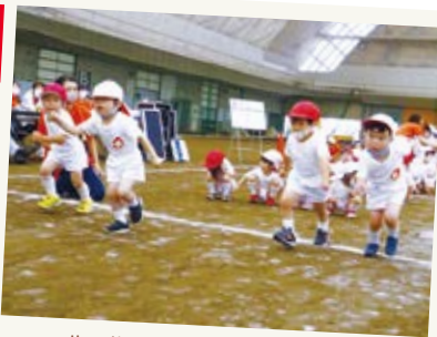
サンドームで初めての運動会! 一生懸命走るぞ☆