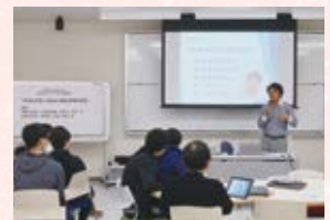
▲ SNSを活用した あおり観光資源の発信