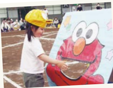
楽しかった運動会! エルモの口にバスケットを 上手に入れることができたよ。