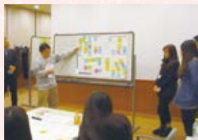
▲ 三内丸山での冬季観光 アクティビティを企画しよう

冬の青森観光の新たな商品開発として、三内丸山遺跡をフィールドに冬季アクティビティ・イベントを企画する、あおりリズム創発塾セミナー「三内丸山遺跡冬季観光」(主催:青森中央学院大学地域マネジメント研究所/青森県)を開催しました。