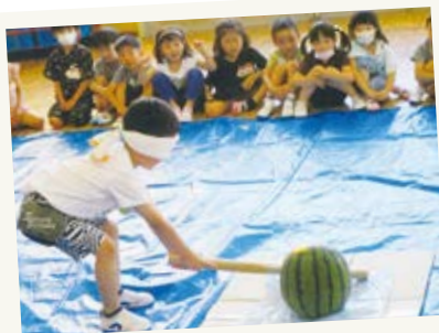
合宿保育の年長さん スイカ割り、みごとにハズレ!次の人ががんばれ!