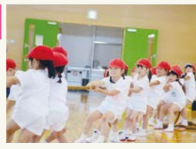
運動会 綱引き、力が入ります。ソ〜レ!ソ〜レ!