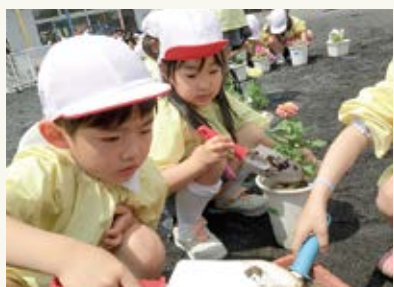
自分で好きな花を選んで、 プランターに植え替えて育てたよ☆