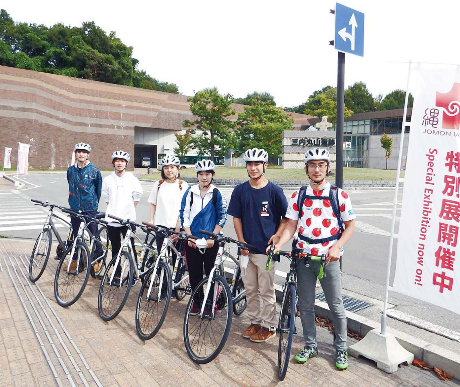
三内丸山遺跡センターにて 経営法学部生による「縄文遺跡を巡るポタリング体験」の試走