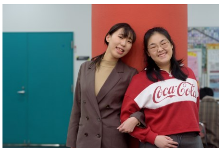
バディの日本人チューター(左)と留学生(右)

https://www.aomoricgu.ac.jp/international_exchange/foreignstudent/tutor_system