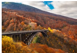
青森市 城ヶ倉大橋(秋)