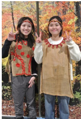
三内丸山遺跡 縄文体験

自然が豊かで四季を楽しむことができます。農林水産業も盛んで、特に「青森のりんご」は世界でも有名です。人々は優しく親切で、物価も安いので、留学する人にとっても生活しやすい環境です。