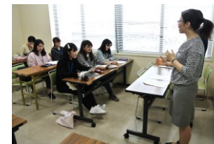
日本語授業の様子

日本人学生が「国際交流学生チューター」として、留学生を支えます。特に最初の半年は1人1人に担当の「ボディ」がつくので、青森での生活や授業に関する不安も解消されるでしょう。